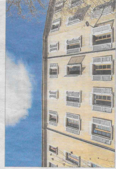
Le comité de sélection n'a pas retenu le projet porté par l'association du Foyer étudiant de Grenoble. Son démantèlement est donc aujourd'hui une hypothèse.